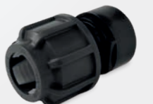
601 – Anschlussverschraubung mit Innengewinde