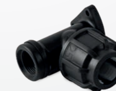
524 – Wandscheibe mit Innengewinde