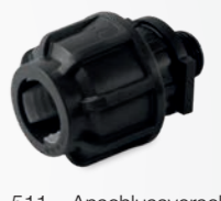
511 – Anschlussverschraubung mit Außengewinde