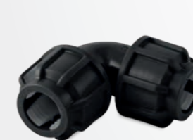
513 – Winkel 90 Grad