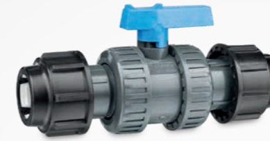
334 – Kugelhahn PN16 EPDM