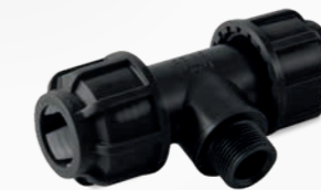
516 – T-Stück 90 Grad mit Außengewinde