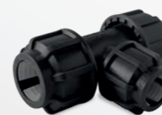
523 – T-Stück 90 Grad reduziert