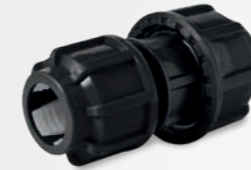
512 – Kupplungsstück reduziert

Weitere Bewässerungs- Komponenten sowie Planung und Auslegung auf Anfrage!