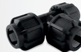
514 – T-Stück 90 Grad