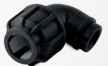
518 – Winkelverschraubung 90 Grad mit Innengewinde