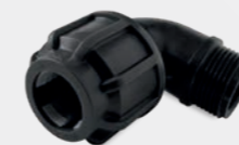
519 – Winkelverschraubung 90 Grad mit Außengewinde