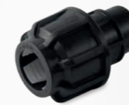
521 – Endkappe