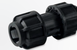
510 – Kupplungsstück