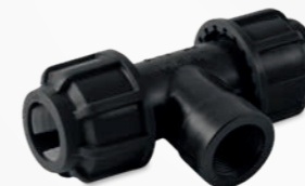
515 – T-Stück 90 Grad mit Innengewinde